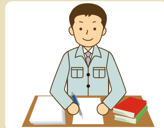
写真付きで報告書作成 郵送または、メールにて報告