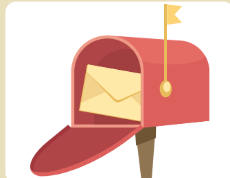
郵便ポスト整理転送