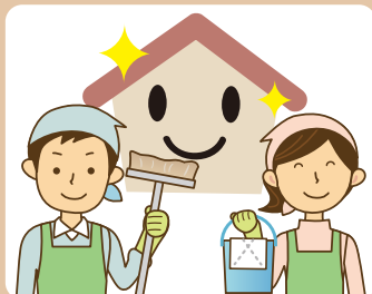
ハウスクリーニング