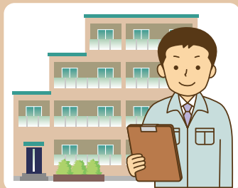
管理組合点検等の立ち合い代行